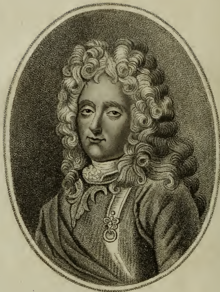
Le Comte Antoine HAMILTON, Né en 1646, mort en 1720